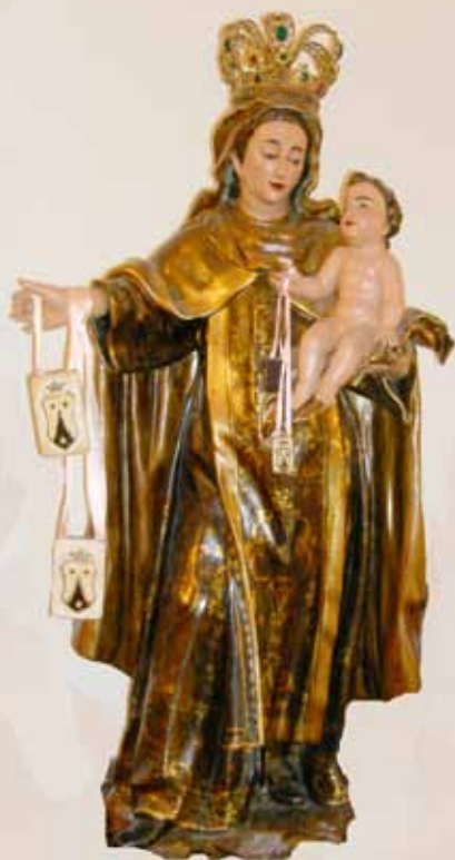
La Carmelita Ortigosa

Organiza: EXCMO. AYUNTAMIENTO DE ORTIGOSA